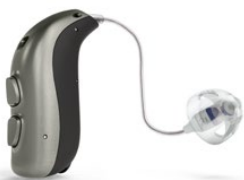
| Bernafon Zerena miniRITE T